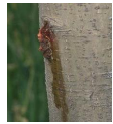
Dégât de larves de zeuzère

Les orifices de pénétration des larves sont marqués par de petits tas de sciure et d'excréments (en forme de petits cylindres) accompagnés d'écoulement de sève, particulièrement visibles sur les grosses branches (voir photo ci-contre).