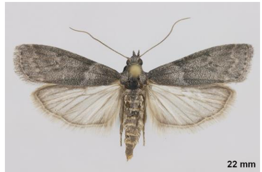
Ectomyelois ceratoniae

Vous pouvez accéder à davantage de photos en consultant ce lien : http://lepiforum.org/wiki/page/Apomyelois_Ceratoniae .